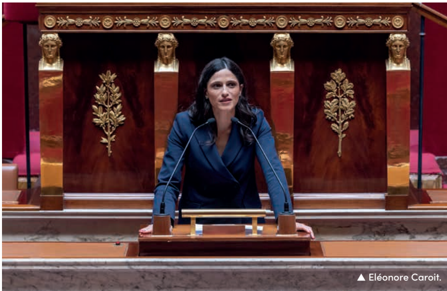
▲ Eléonore Caroit.

Questions à la députée Renaissance Eléonore Caroit, réélue en avril 2023 à la tête de deuxième circonscription des Français de l'étranger (Amérique latine et Caraïbes).